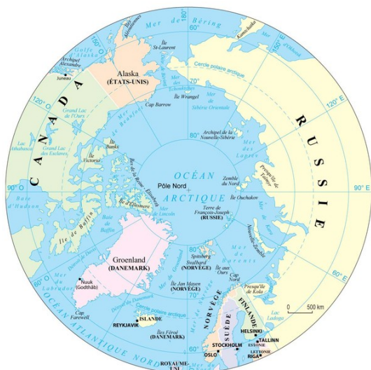
Carte 1 : La région arctique

L'emprise des États côtiers sur l'Arctique est longtemps demeurée limitée. L'hostilité des lieux y est pour quelque chose : la présence d'une banquise perpétuelle et d'icebergs à la dérive rendent la navigation et l'exploitation de cet océan difficiles, voire impossibles. Cette situation est en train de changer. La fonte des glaces générée par le réchauffement climatique 18 entraîne deux conséquences susceptibles de réveiller l'appétit des États : l'ouverture de voies d'eau (I) et l'accessibilité des fonds marins (II).